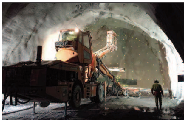
Travaux de forage avec une machine à bras multiples.

Nous visiterons ainsi des chantiers de creusement et l'usine à voussoirs proche.