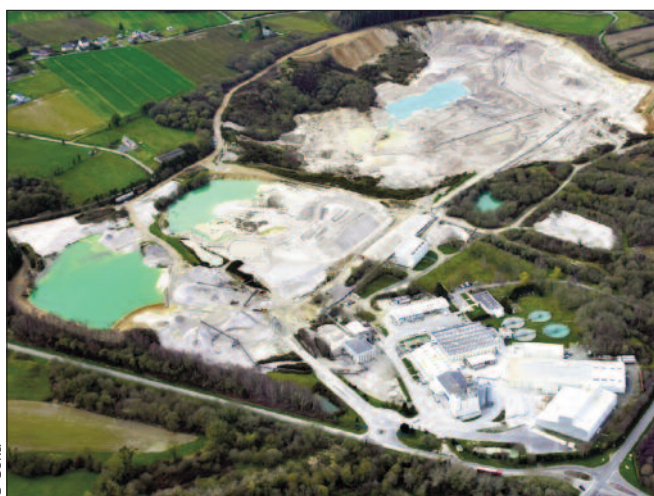
Carrière Soka à Quessoy.