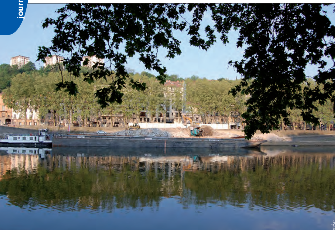
Évacuation des matériaux abattus sur le côté Saône

La première opération est le coulage des banquettes latérales sur 1 mètre de hauteur, incluant le caniveau de récupération des eaux, puis le captage des venues d'eau existantes et leur amenée par drains dans le caniveau.