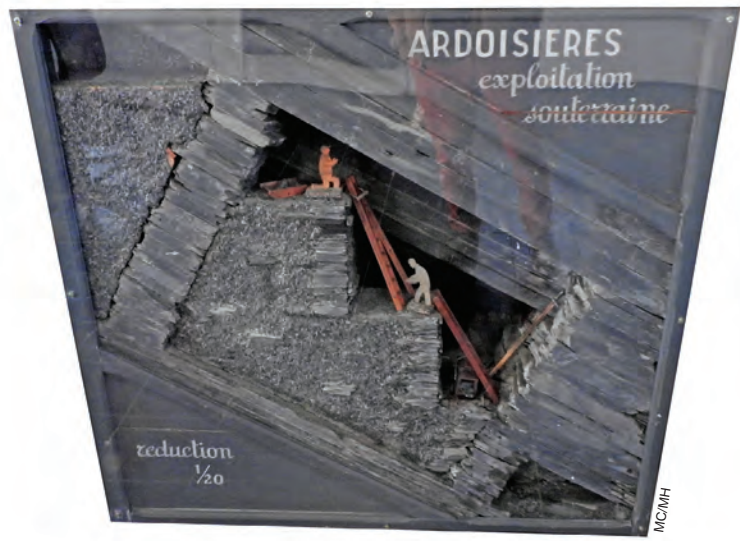
Maquette d'une exploitation souterraine.