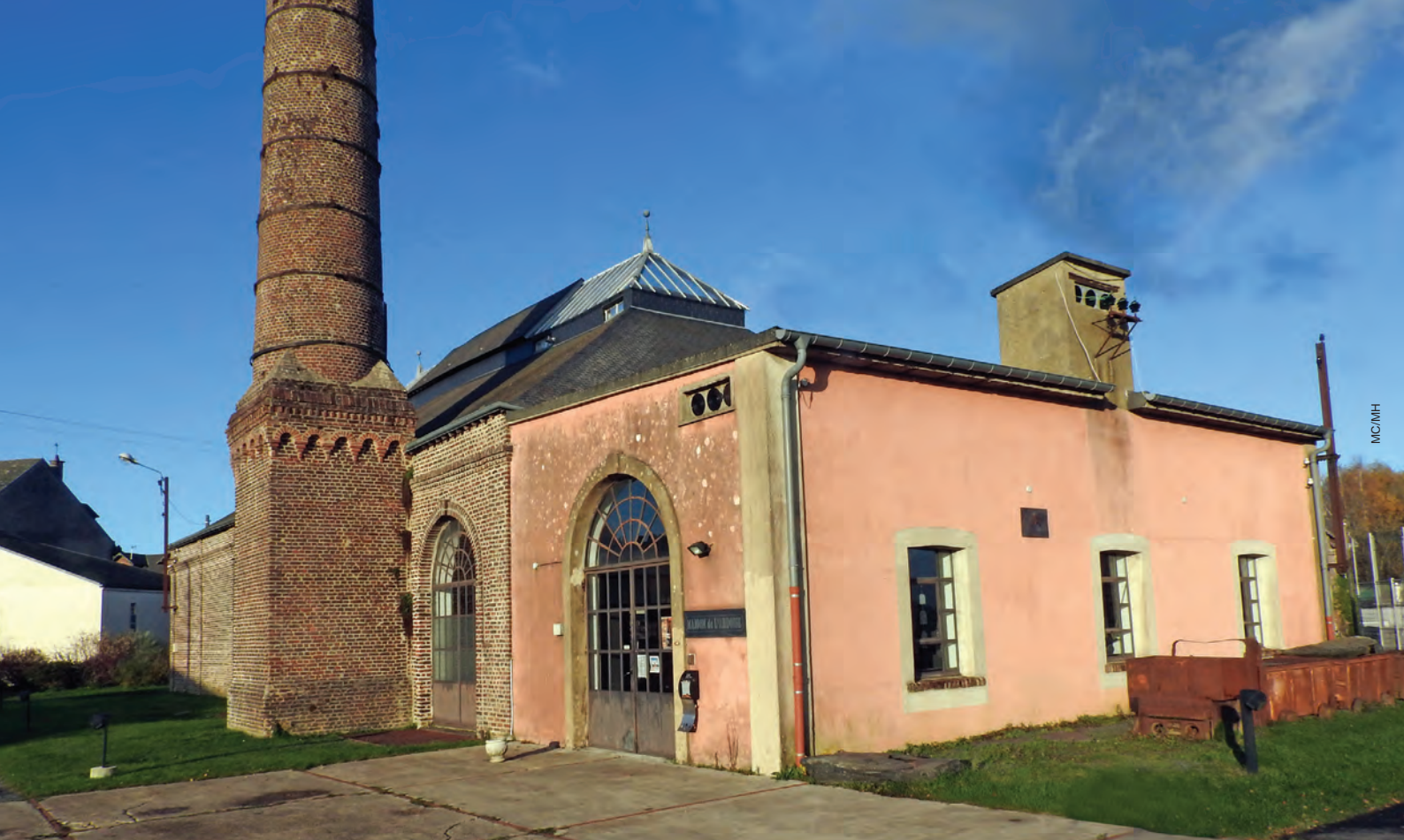
La maison de l'ardoise est abritée dans l'ancienne centrale électrique. Devenu un musée municipal, le bâtiment est un lieu de patrimoine unique dans les Ardennes retraçant l'histoire de l'épopée ardoisière.

Pour que l'exploitation des fosses eût été rentable, il aurait fallu creuser de plus en plus profondément, ce que les moyens techniques de l'époque ne permettaient pas. Les fosses vivotèrent et cela d'autant plus que la main-d'œuvre se raréfiait du fait de la Grande peste et de la guerre de Cent Ans. Le pouvoir royal étant fortement endetté par les frais de guerre, il obtint que le clergé de France contribuât à éponger ses dettes, et les abbayes furent obligées de vendre tout ou partie de leurs domaines. Foigny vendit tout son domaine en 1577, Signy se sépara de sa maison de Rimogne (le futur château de l'Enclos) la même année. Seule Bonfontaine sembla conserver son domaine.