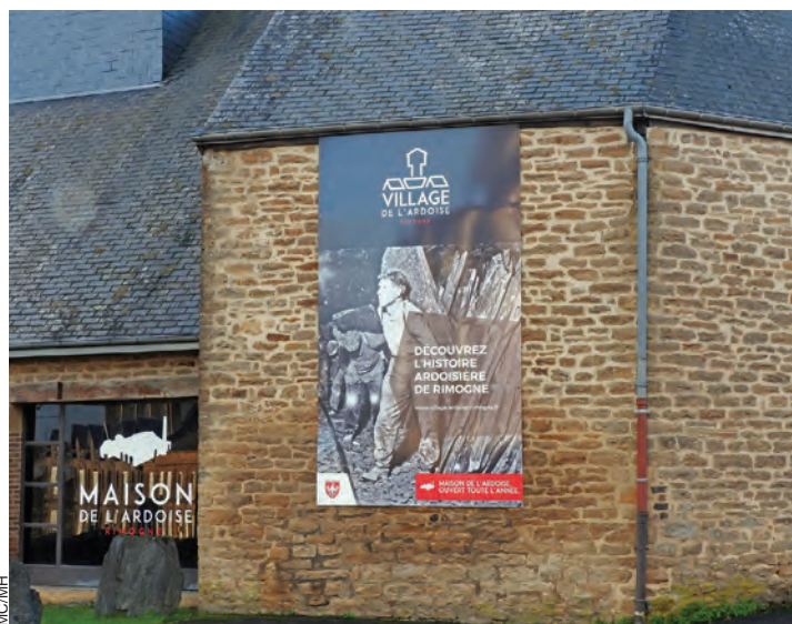
Le village offre un parcours à découvrir avec ses hauts lieux.

Site Web : www.village-ardoise-rimogne.fr