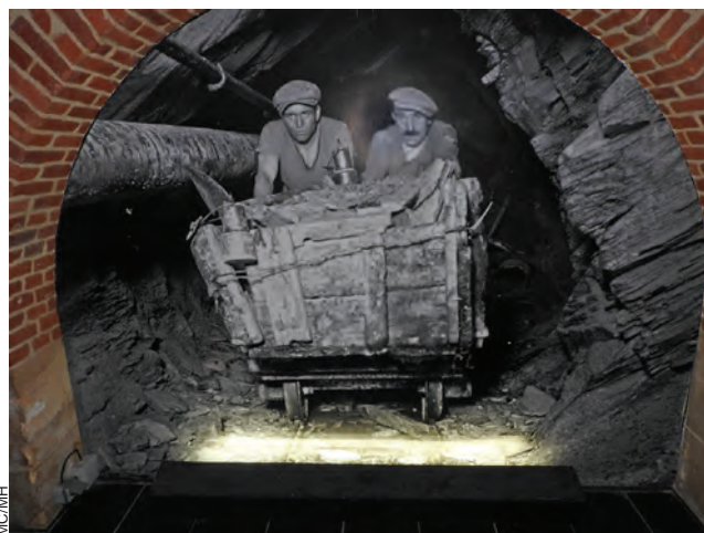
L'exposition permet de découvrir les conditions éprouvantes d'extraction mais aussi la vie quotidienne des écaillons – les ardoisiers – et de leurs familles à Rimogne.