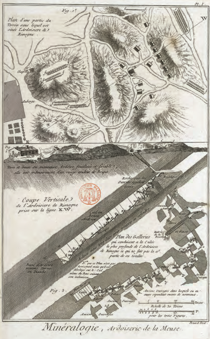
On peut noter une illustration exceptionnelle dans l'Encyclopédie de Diderot et d'Alembert, au sein du tome de planches VI, section « Histoire naturelle. Minéralogie ». Les ardoiseries de la Meuse sont magnifiquement illustrées, en carte et en coupe, permettant d'apprécier le pendage de la couche d'ardoise.