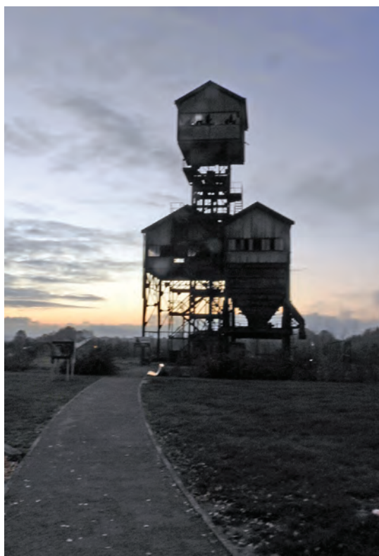
Le dernier chevalement des Ardennes, au puits Saint-Quentin, a été inauguré en 1961. Il permettait de descendre par groupe de douze entre 90 et 120 m de profondeur, en une demi-minute. Arrêté en 1971 avec la fermeture du puits, il résiste aux intempéries et demeure le témoin de l'activité ardoisière de Rimogne.