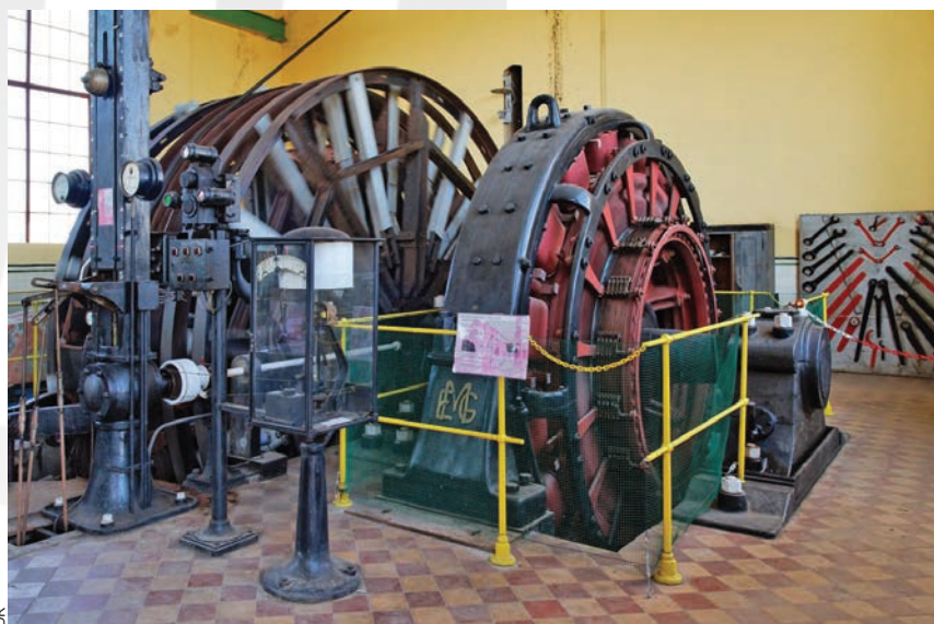
Machine d'extraction du carreau Rodolphe à Pulversheim.

Les visiteurs découvrent également un ensemble complet et unique en France de machines minières allant des années 1950 à 2004. Le parcours est très pédagogique et on ressent bien la passion du guide au travers des explications qu'il fournit avec force détails. La reconstitution de la taille est particulièrement réussie !