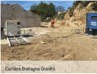
Carrière Bretagne Granits

abordera l'ensemble de la chaîne de fabrication, depuis l'extraction du matériau de base jusqu'aux produits finis.